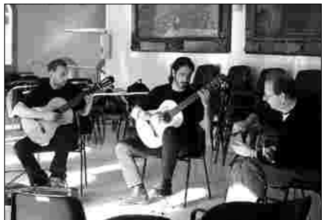
Algunos de los alumnos asistentes al seminario