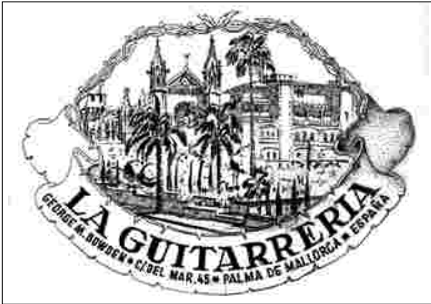
Etiqueta de La Guitarrería (1969)