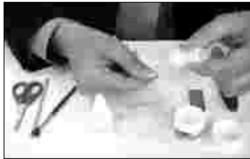
Uno de los pasos de la utilización de Nailkit

Como fabricante de cuerdas para guitarra, y como guitarrista flamenco, he desarrollado un sistema completo para la reparación y mantenimiento de las uñas que tiene en cuenta casi cualquier situación en la que el guitarrista puede encontrarse.