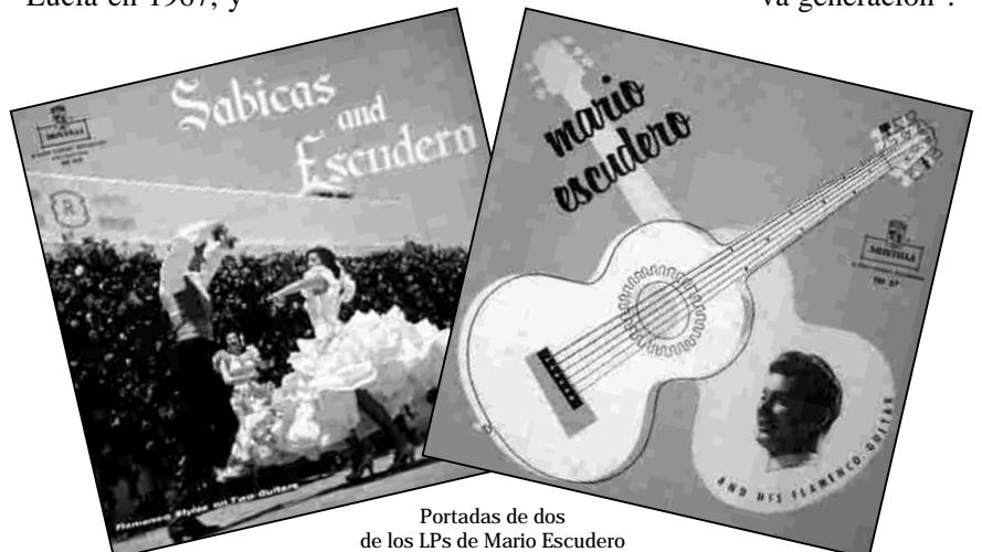
Portadas de dos de los LPs de Mario Escudero

Para terminar, una cita de Ramón Montoya: “Mario Escudero es el mejor guitarrista de esta nueva generación”.