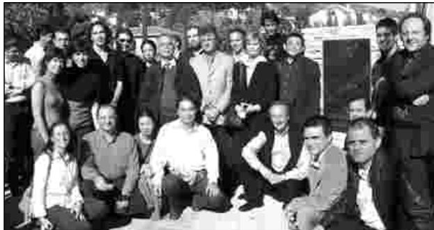
El acto reunió a músicos y representantes de la sociedad alcoyana

Uno de los puentes de la ciudad alicantina llevará su nombre